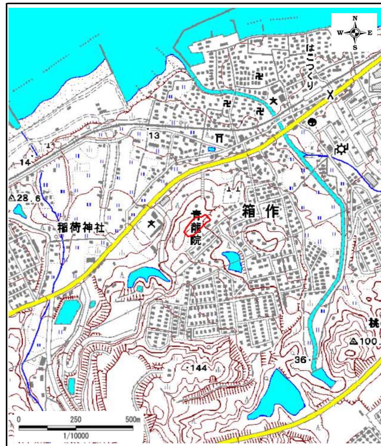
区域指定箇所位置図(1/10,000)