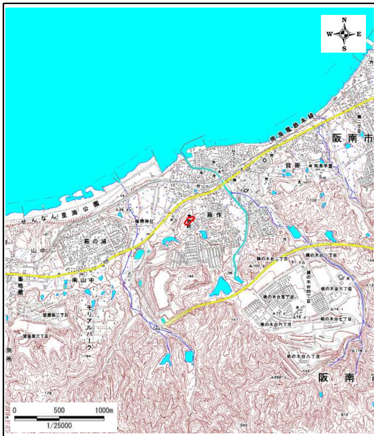
区域指定箇所概略位置図(1/25,000)