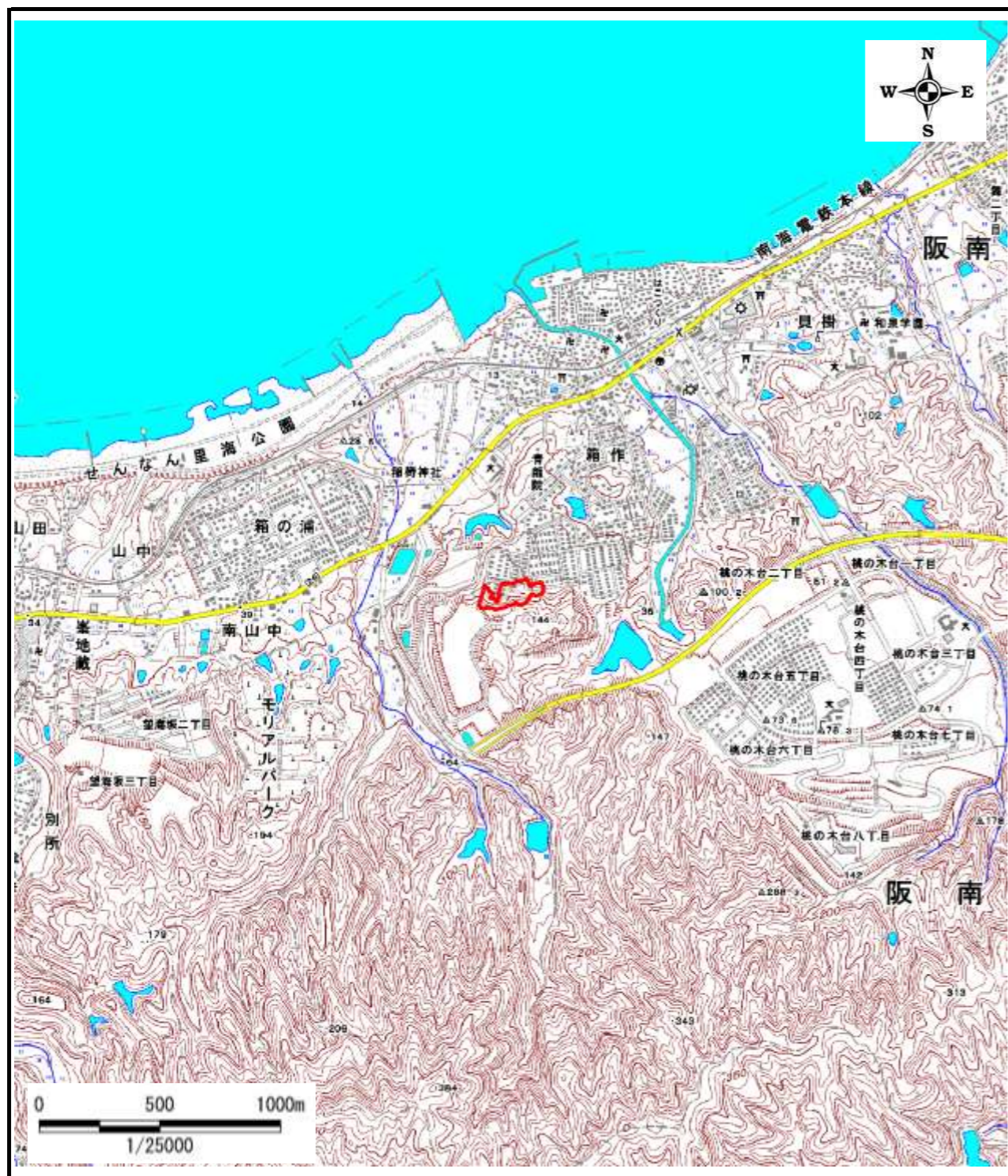
区域指定箇所概略位置図(1/25,000)