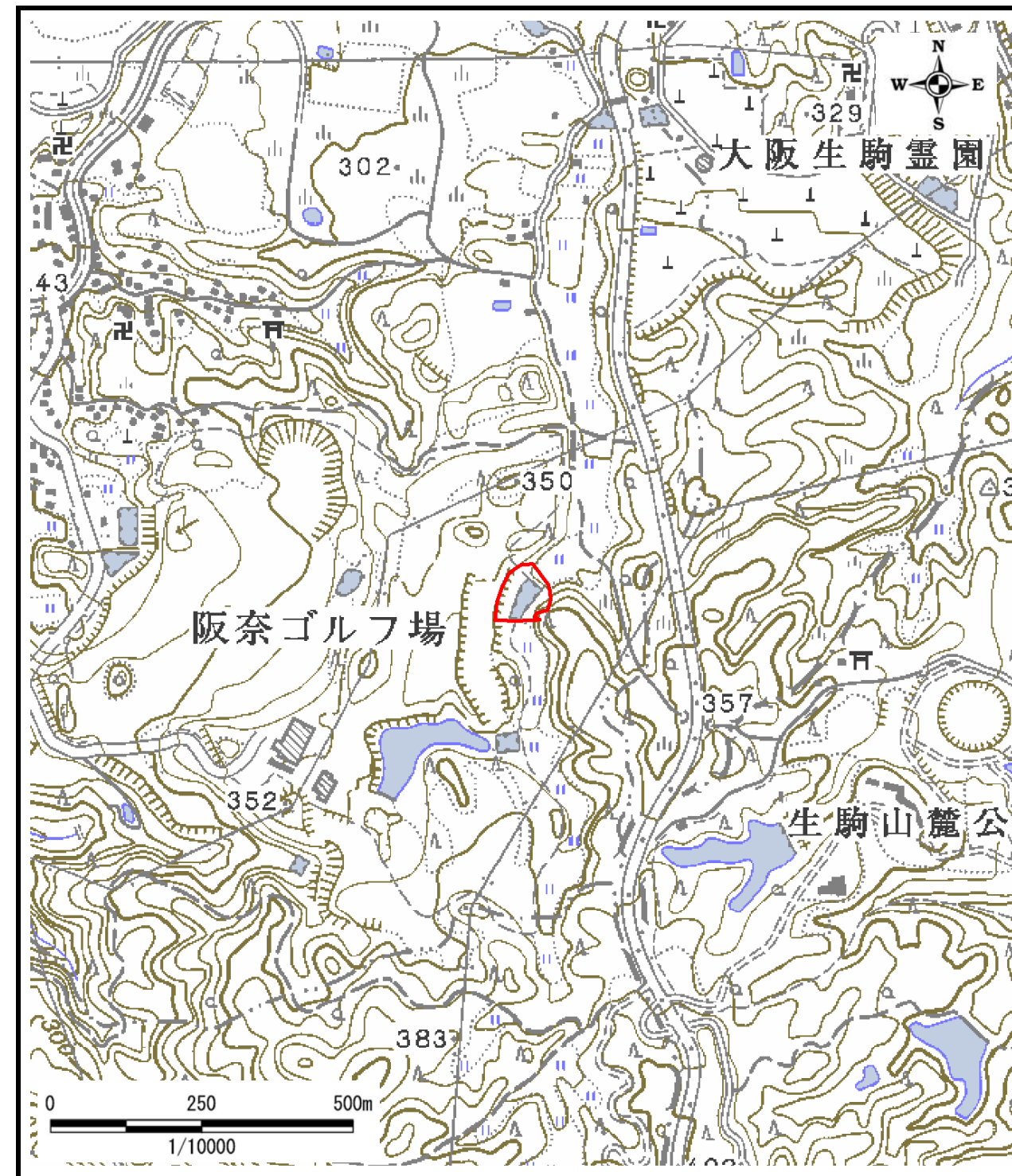
区域指定箇所位置図(1/10,000)