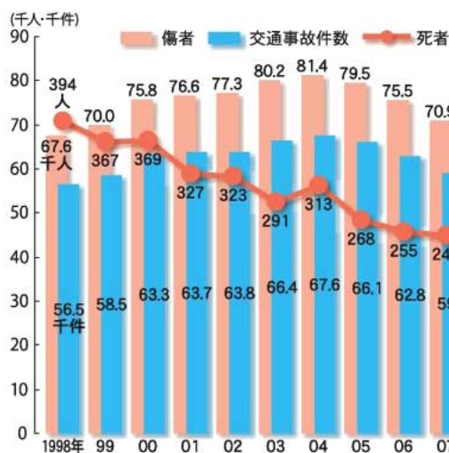
図3 交通事故件数と傷者・死者の推移