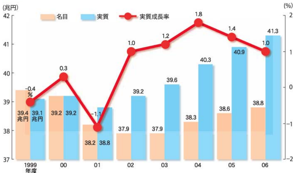
図1 府内総生産(生産側)の推移