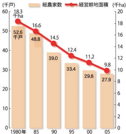
図1 総農家数と経営耕地面積の推移