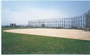
多目的グラウンド