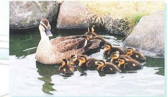
水辺の広場の「カルガモ親子」

開放時間／8：00～17：00 (多目的グラウンドの使用時間／8：30～16：30) 休 み／毎週火曜日及び12月29日～1月3日 問い合わせ先／スカイランド管理棟 (06-6789-7152)