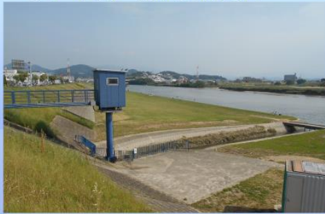
(大和川と玉串川、玉串川の生き物)