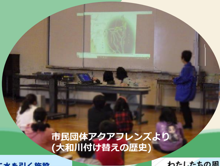
(大和川付け替えの歴史)