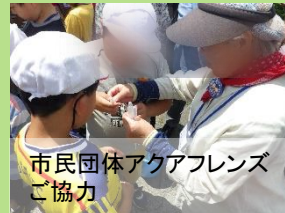
市民団体アクアフレンズ ご協力

パックテストを用いて長瀬川の 水質測定しました。 透視度チェックも行い、 水質への関心を持って頂けました。