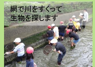
網で川をすくって 生物を探します