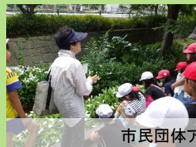
市民団体アクアフレンズご協力