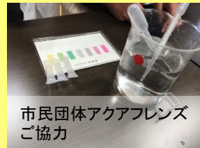
市民団体アクアフレンズ ご協力

調味料の入った水を パックテストで水質測定し 結果や色、においから、 どういった調味料が入った水なのか 検討しました。