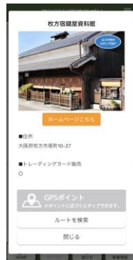
チェックポイント画面