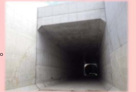
▲完成したトンネル本体

府道大阪高石線から大和川線への出入口の地下トンネルが平成27年10月に完成しました。今後、地上部などにおける残りの工事を行っていきます。