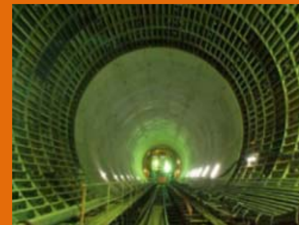
◀シールドマシン(直径12.5m)