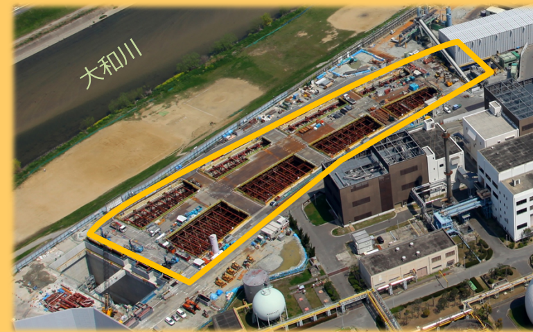
▲工事箇所の航空写真

今池水みらいセンターの中で、地上から約40m下まで土を掘って、トンネル本体を造る工事を行っています！