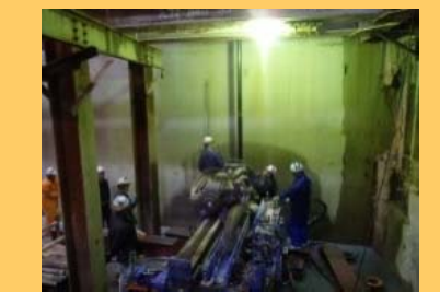
▲凍結工法の作業状況