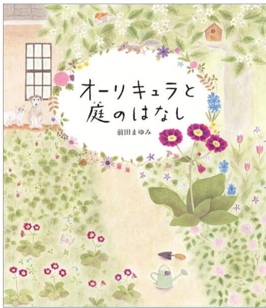
『オーリキュラと庭のはなし』 作：前田まゆみ アリス館