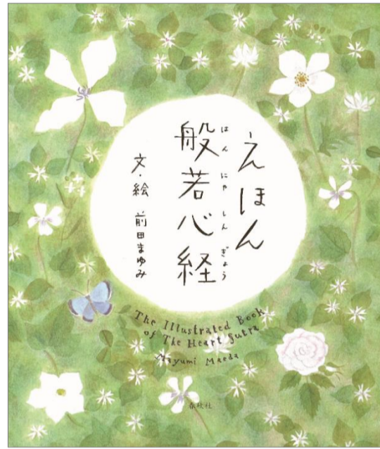
『えほん 般若心経』 文・絵：前田まゆみ 春秋社