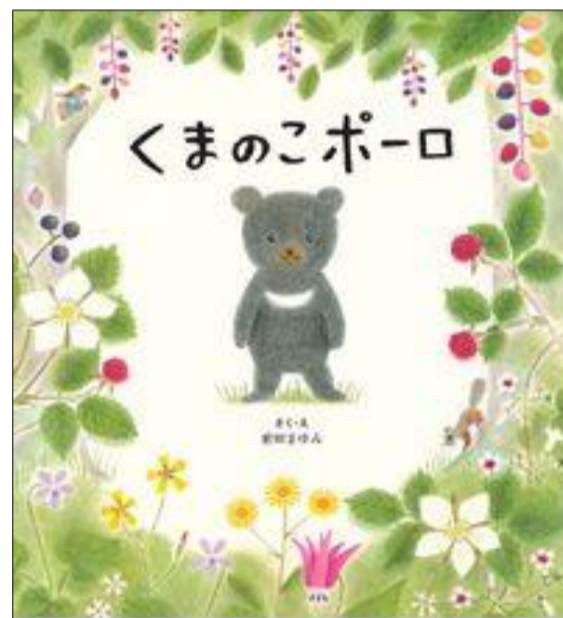
『くまのこポーロ』 さく・え：前田まゆみ 主婦の友社