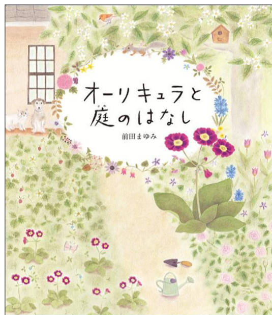
『オーリキュラと庭のはなし』 作：前田まゆみ アリス館