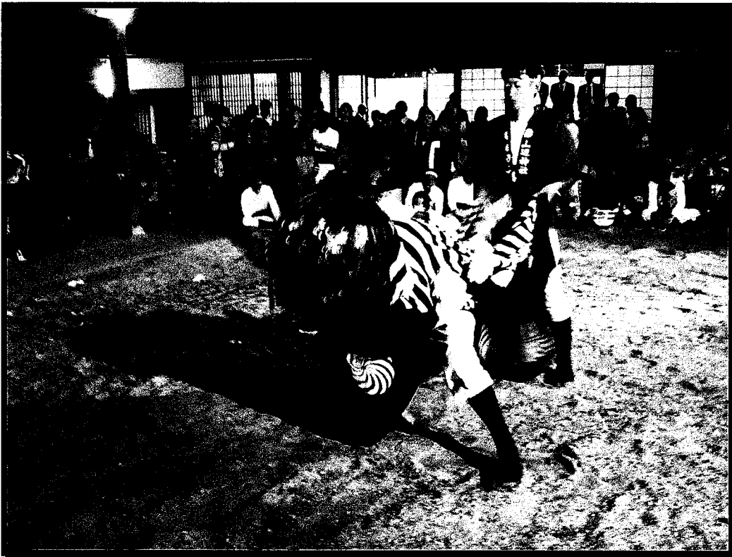
山辺の獅子舞 (平成27年10月11日撮影)