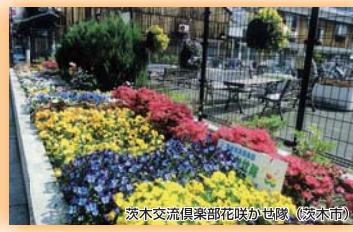
茨木交流倶楽部花咲かせ隊(茨木市) 奨励賞