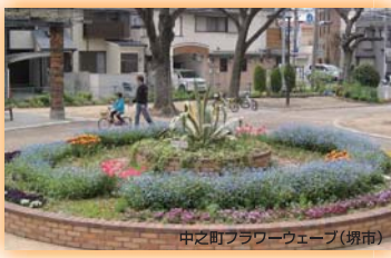
中之町フラワーウェーブ(堺市) 大阪府知事賞