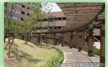
サンマークスタッド(守口市) 大阪府都市緑化フェア実行委員会長賞