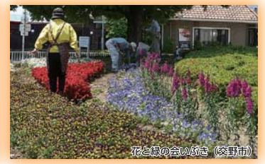
花と鳥の会いがき(交野市) 奨励賞