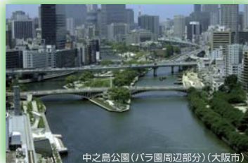
中之島公園(パラ園周辺部分)(大阪市) 大阪府知事賞