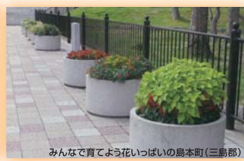
みんなで育てよう花いっぱい島本町(三島郡) 大阪府都市緑化フェア実行委員会長賞