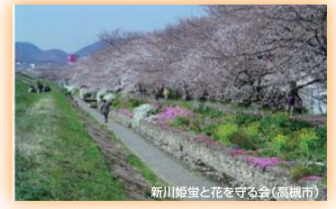
新川姫並と花を守る会(高槻市) 大阪府知事賞