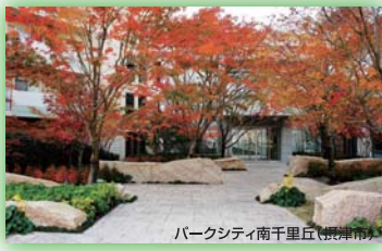
パークシティ南千里丘(堺市) 大阪府知事賞