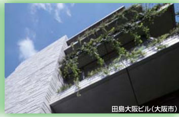
田島大阪ビル(大阪市) (一社)ランドスケープコンサルタンツ協会 関西支部長賞