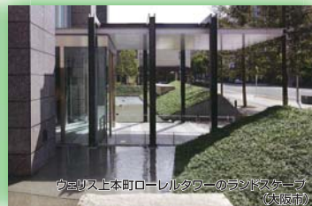
ウエイズ上本町ローレルタワーのランドスケープ(大阪市) (社)ランドスケープコンサルタンツ協会 関西支部長賞