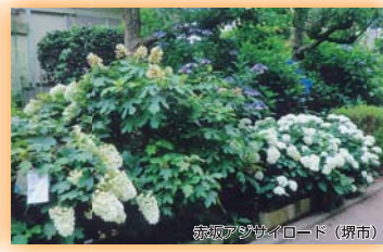
赤坂アジサイロード(堺市) (財)国際花と緑の博覧会記念協会会長賞