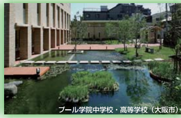
プール学院中学校・高等学校(大阪市) (財)国際花と緑の博覧会記念協会会長賞