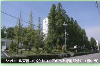
シャレール東豊中(メタセコイアのある緑地部分)(豊中市) 大阪府都市緑化フェア実行委員会長賞