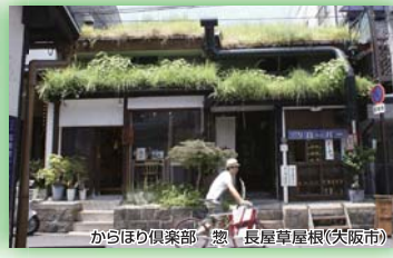
からほり倶楽部-憩-長屋草屋根(大阪市) 特別賞(審査委員長賞)