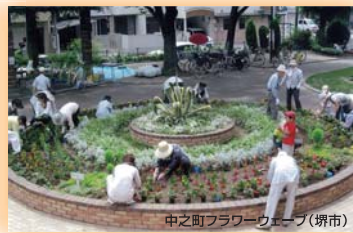
中之町フラワーウェーブ(堺市) (社)ランドスケープコンサルタンツ協会 関西支部長賞