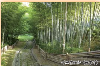
千里竹の会(豊中市) (財)国際花と緑の博覧会記念協会会長賞