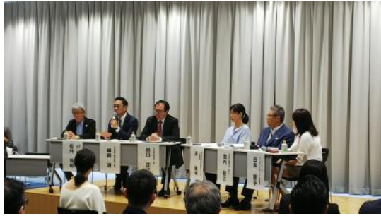
パネルディスカッション1