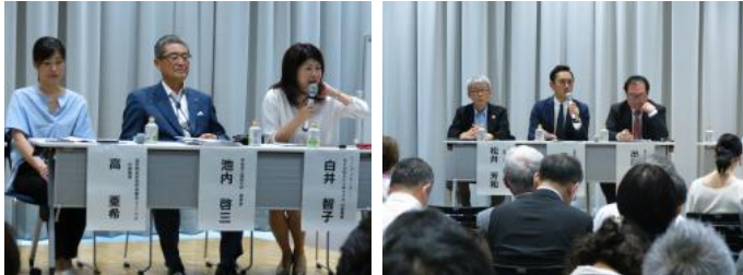
パネルディスカッション2