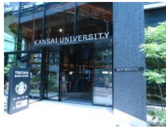
関西大学梅田キャンパス