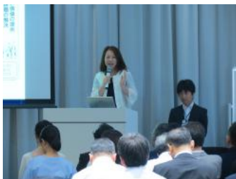
大阪府公民戦略連携デスク

大阪府公民戦略連携デスクより、「大阪府における公民連携の取組み」について、大阪府市民局より、「大阪府市民活動総合ポータルサイト」「企業との連携」についてプレゼンテーションを行いました。