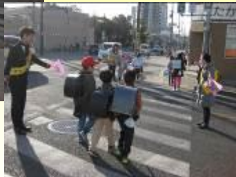
元気な声であいさつ