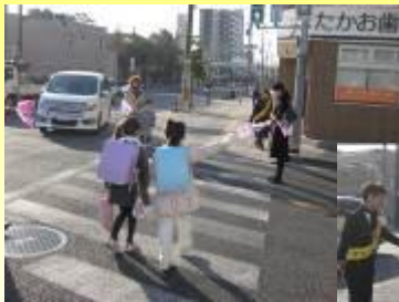
車に注意して登校

学校周りの交通量が大変多いため、PTAの方々と協力して、学校近くの交差点であいさつ運動と交通安全の見守り活動を行っています。登校してくる子どもたちは車にも気を付けて、元気にあいさつをしてくれています。