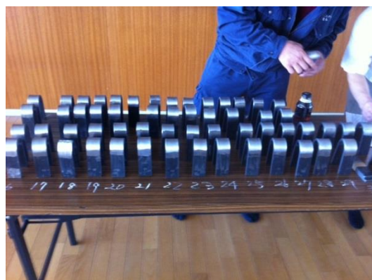
工業高校（JIS 対策研修モギ試験）