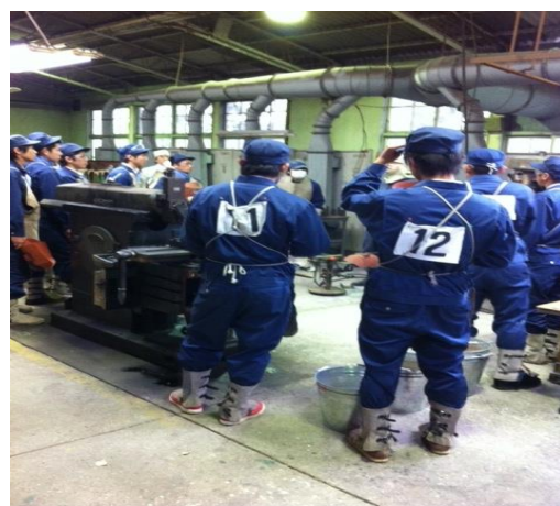
工業高校に対するアーク溶接特別教育

企業 16 社に同講習を実施し、研修センターで 320 名の研修を行ないました。