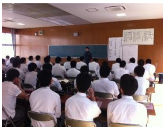
工業高校（JIS 試験対策研修座学）