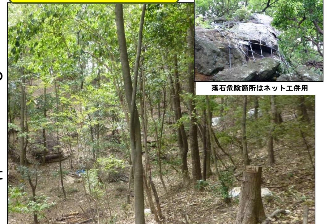
落石危険箇所はネット工併用