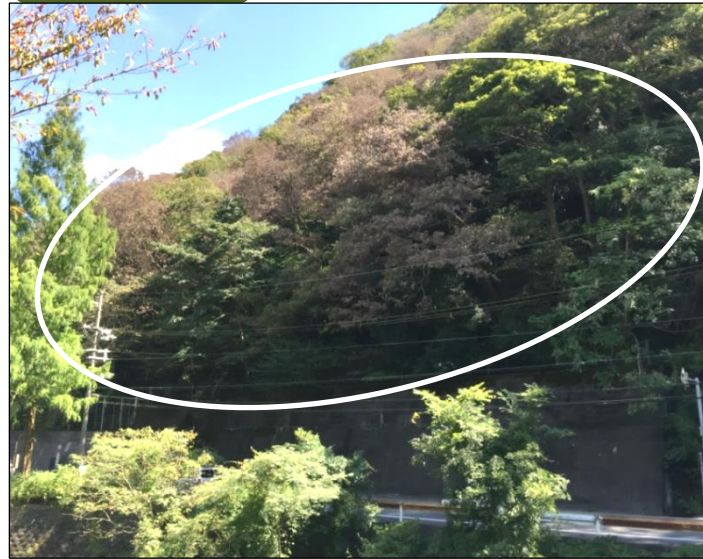
ナラ枯れの状況（交野市）