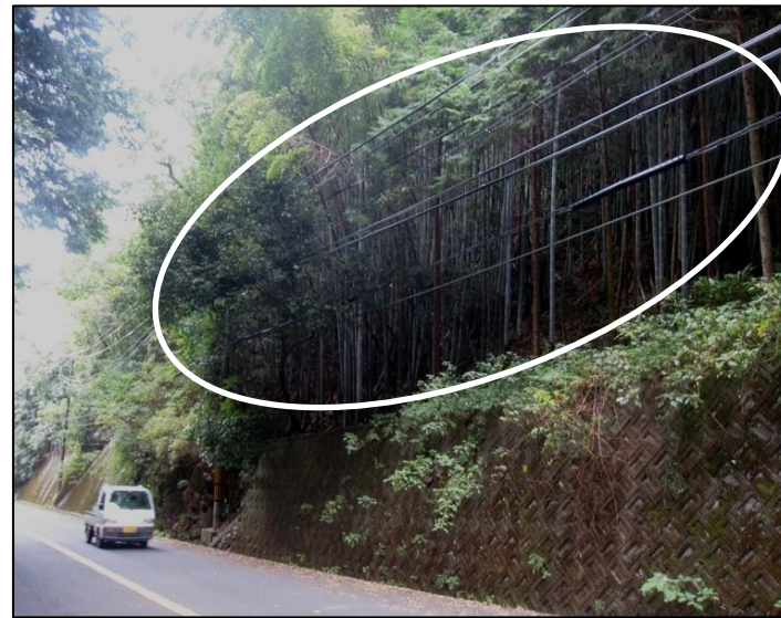
放置竹林の状況（和泉市）