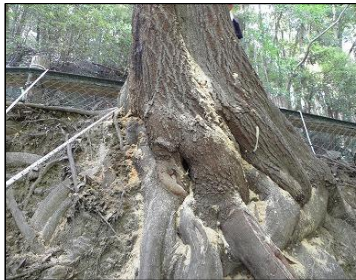
被害を受け木くずが根元に散乱した木