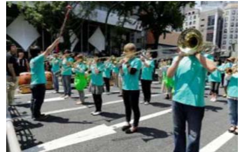
※写真は昨年度の「みんなでkappo!御堂筋フェスタ2013」の様子です。