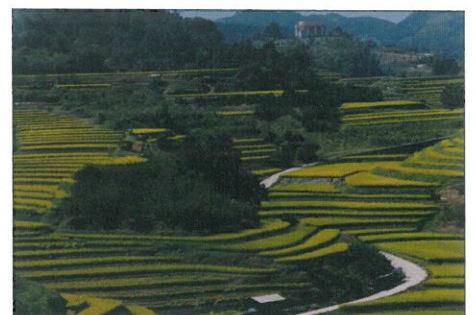
自然とみどりの展示品