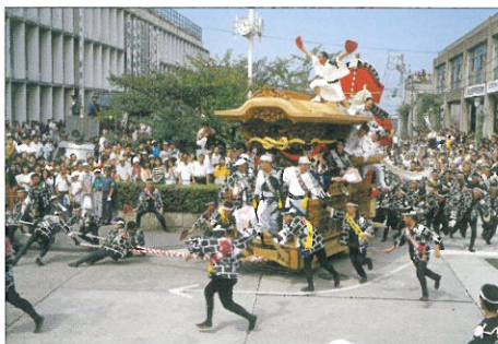
にぎわいあふれる催し