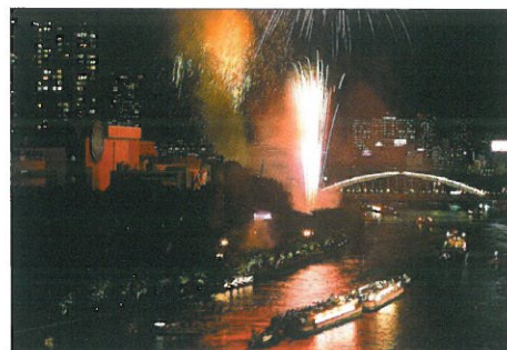
にぎわいあふれる催し