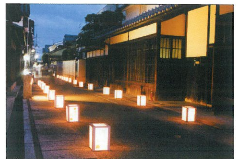
時代感あふれる展示品