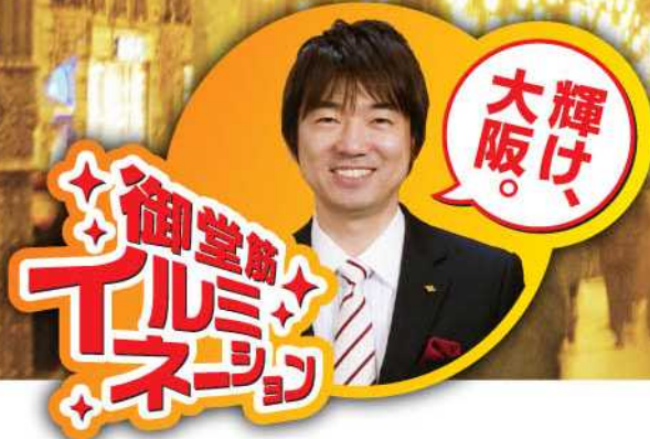
これはイメージ写真です

大阪の将来を輝かせるために、 もっと大阪を明るく元気にするために、 「御堂筋イルミネーション」をはじめました。