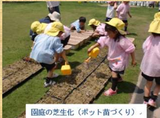
園庭の芝生化（ポット苗づくり）