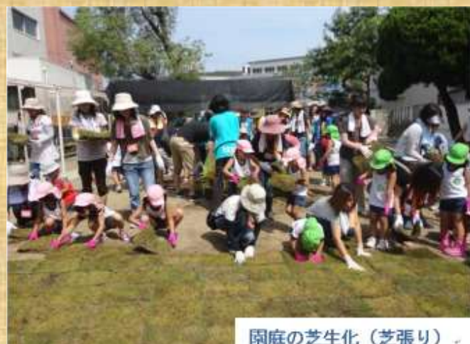
園庭の芝生化（芝張り）