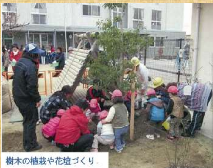
樹木の植栽や花壇づくり