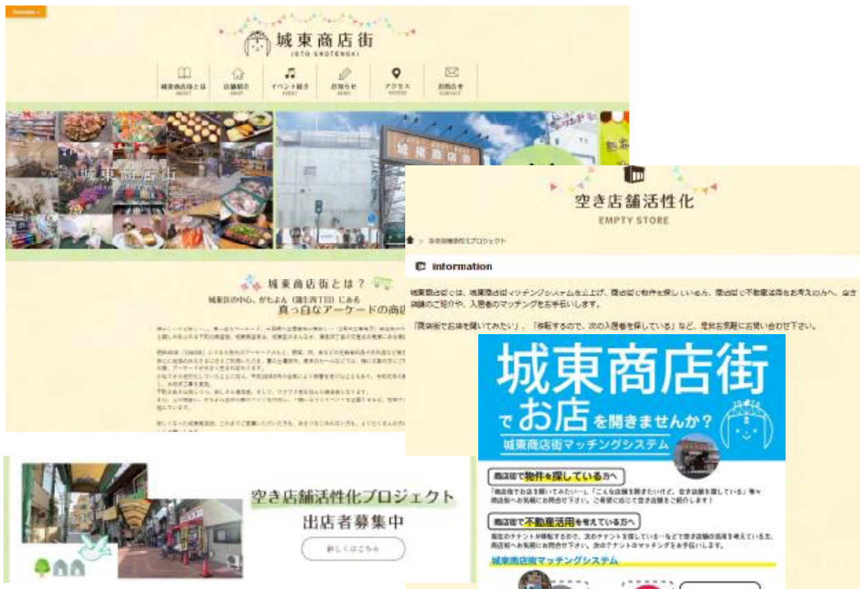
017 城東商店街公式ホームページにてマッチングシステムの紹介