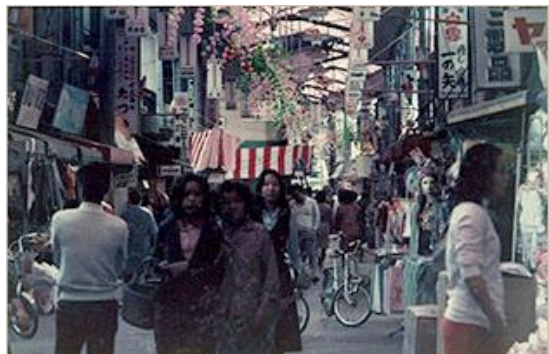
昭和55年頃（最盛期）の 城東商店街