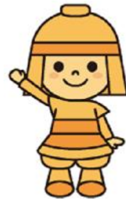
高槻市マスコットキャラクター 「はにたん」