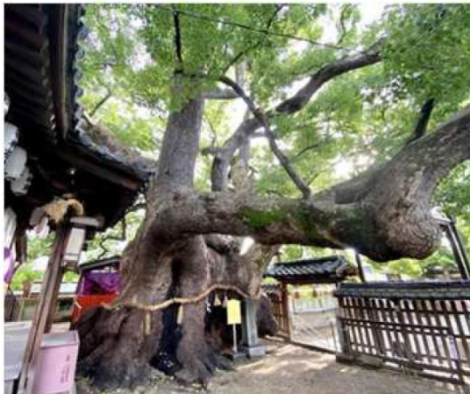
【三島神社 大クスノキ「薫蓋樟」】

計画地近隣の三島神社境内には「薫蓋樟」と呼ばれる樹齢1000年以上の大クスノキがあり昔からこの地域を見守ってきた。門真市内には多くのクスノキがあり、クスノキは「市の木」にも制定されている。