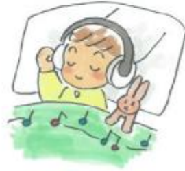
大阪府健康医療部 保健医療室