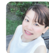
もりた 森田 かずよ (ダンサー・俳優)