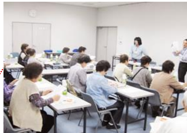
○認知症サポーター養成講座

職員向けに認知症サポーター養成講座を行っており、500名以上の認知症サポーターが在籍しています。