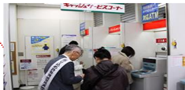
○振り込め詐欺防止

職員向けに認知症サポーター養成講座を行っており、500名以上の認知症サポーターが在籍しています。