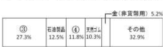
コートジボワールの輸出品割合 (2011年, 110億ドル)