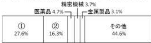
ドイツの輸出品割合 (2011年, 1兆4822億ドル)