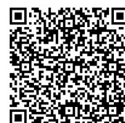
「抗原定性検査キットの配布 事業（大阪府検査キット配布 センター）」

詳細は大阪府ホームページ「抗原定性検査キットの配布事業 (大阪府検査キット配布センター)」をご参考ください。