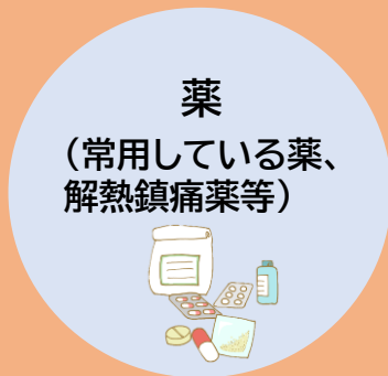
薬 (常用している薬、 解熱鎮痛薬等)