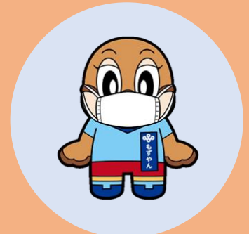
有症状時の マスクの着用を含む 咳エチケット