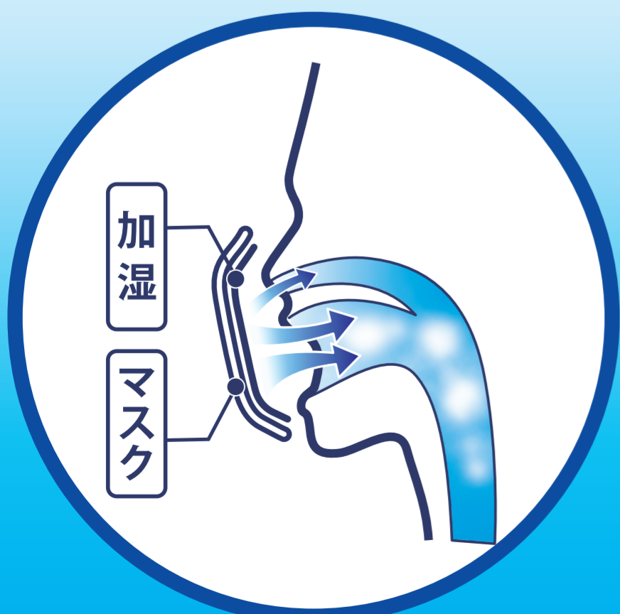
のどの加湿にマスク