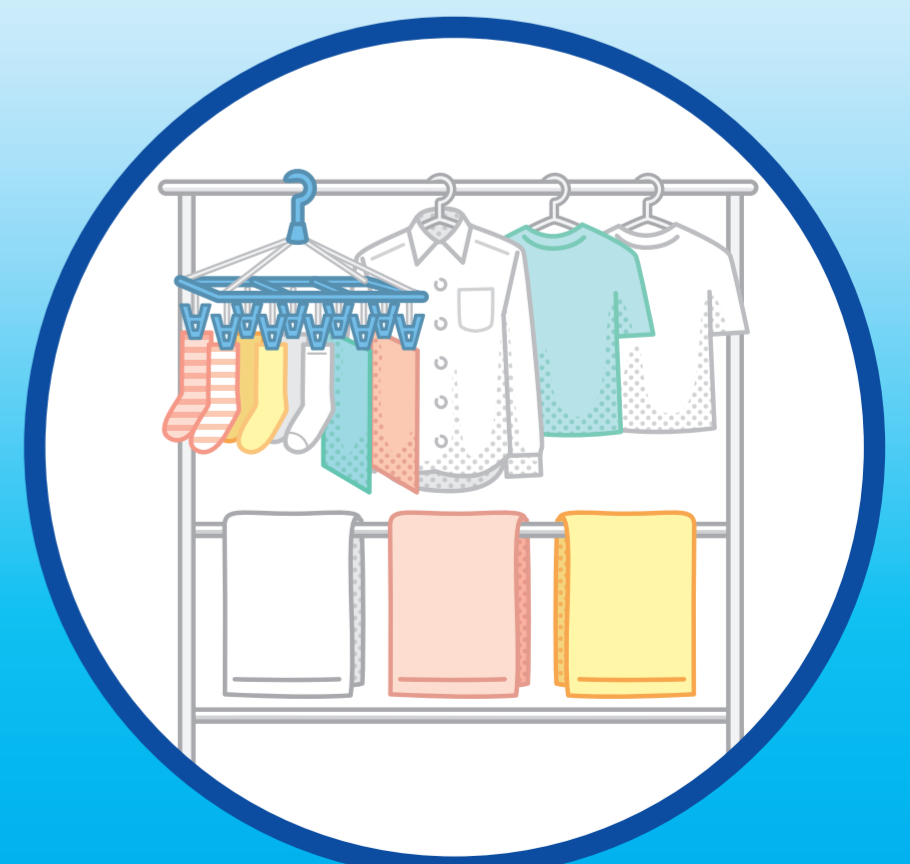
洗濯物の室内干し