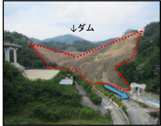
②安威川左岸から右岸を望む(東から西)