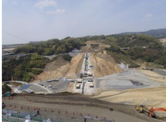
③安威川右岸から左岸を望む(西から東)