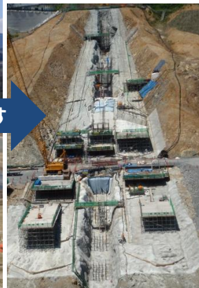
監査廊のイメージ