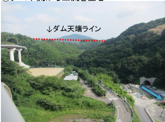
①ダム下流から上流を望む