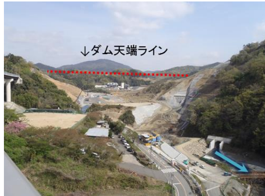
②安威川左岸から右岸を望む(東から西)