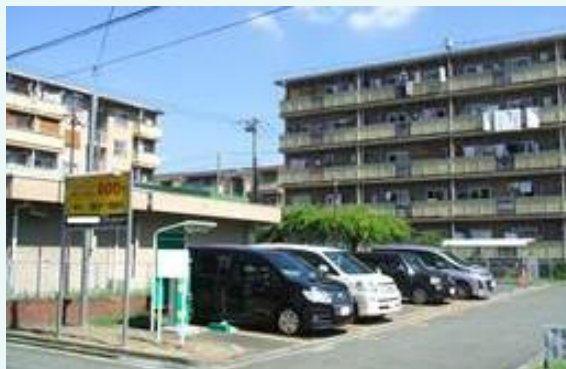
コインパーキング（活用面積約68㎡）