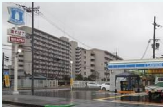
コンビニエンスストア（活用面積約902㎡）