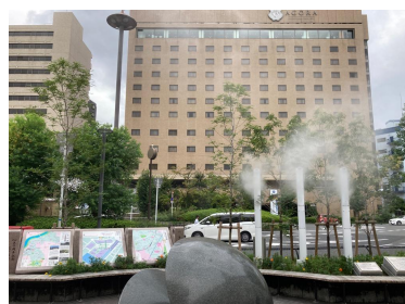
京阪・守口市駅 (R3年度竣工)