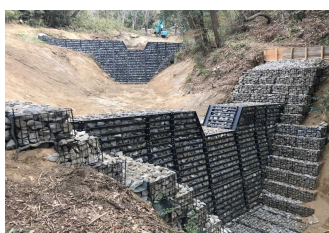
大東市寺川地区 (H30年度竣工)