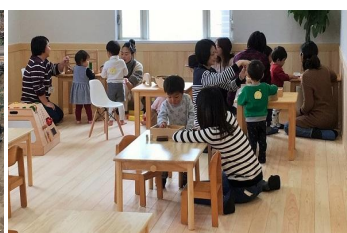
幼稚園の内装木質化