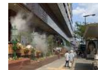
緑化と微細ミスト