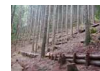
本数調整伐と筋工の面的整備