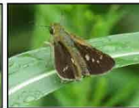
イチモンジセセリ