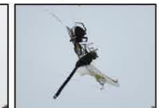
キンヤンマ・オニグモ