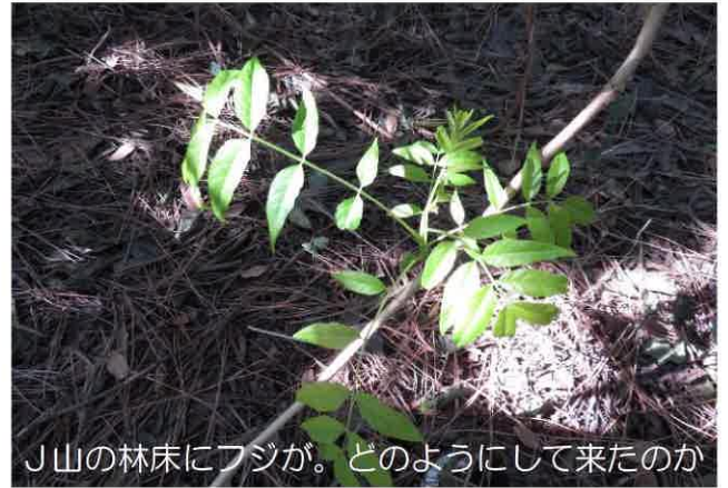
J山の林床にフジが。どのようにして来たのか