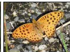
ツマグロヒョウモン