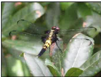
オオシオカラトンボ【初登場】 「共生の森」14番目のトンボ