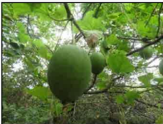
キカラスウリ【初登場】