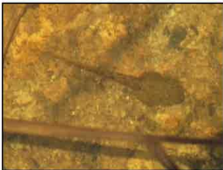
オタマジャクシ(ヌマガエル)