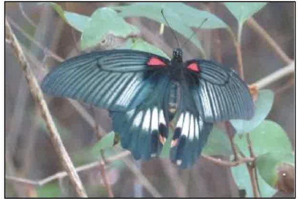
「共生の森」にやってきた 29 番目の蝶