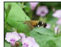
ヒメクロホウジャク