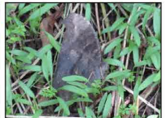
クロコノマチョウ