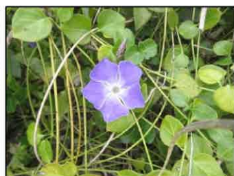
ツルニチニチソウ