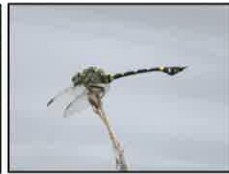
タイワンチワヤマ