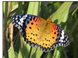
ツマグロヒョウモン