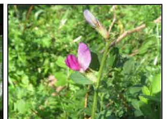
カラスアエンドウ(今年初)