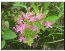
ハナハマセンブリ