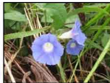
マルハアメリカアサガオ