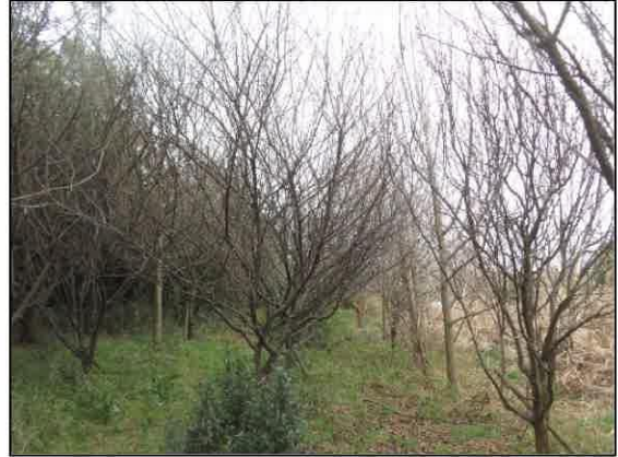
今年はJ山東側の ウメの花は咲かなかった