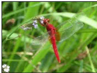
ショウジョウトンボ