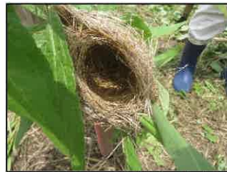
鳥の巣(同定願います)