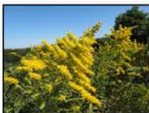
セйкаカアワダチソウ