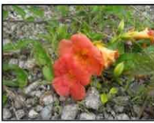
アメリカウゼンカズラ