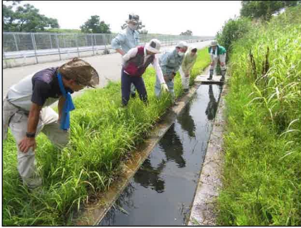
メダカがいる水路