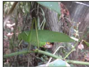
サトクダマキモドキ