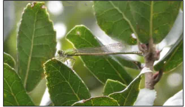
「共生の森」にやってきた15番目のトンボ