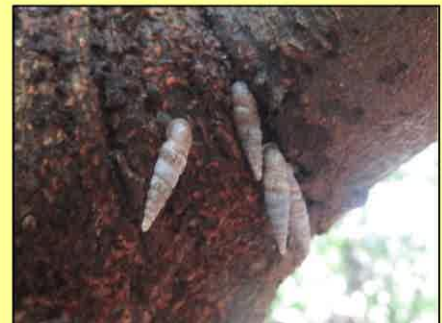
集団で木に登る陸貝がいた