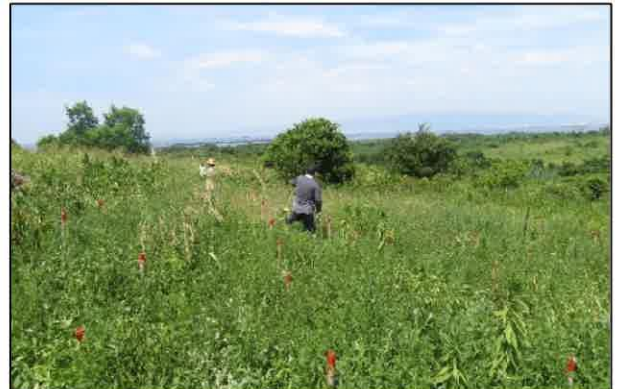
この日の大阪の最高気温は 37.1 度