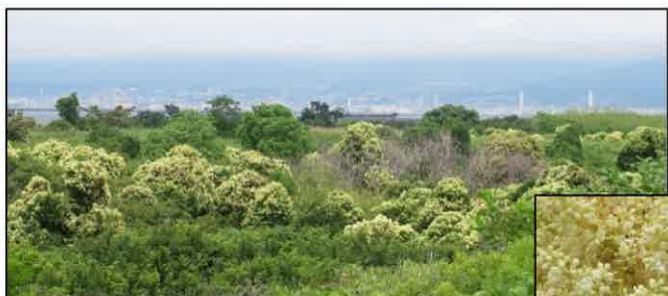
トウネズミモチの花が咲く