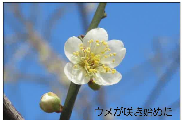
ウメが咲き始めた

フェニックスはどこから運ばれてきたのでしょうか。ビワの大きな種は誰が運んできたのでしょうか。