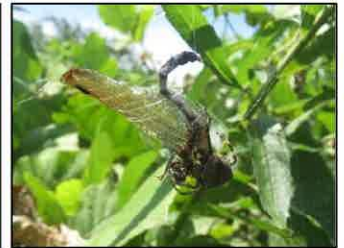
トンボを捉えたオニグモ