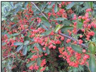
ピラカンサ(トキワサンザシ)