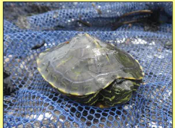
大きさからして、ここで生まれたか