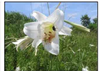
シンテッポウユリ ?