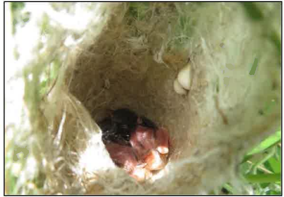
草刈り中に「セッカの巣」が見つかる