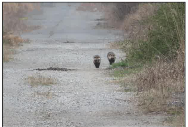
この季節 タヌキをよく見かける