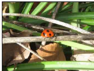
ナナホシテントウ