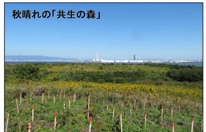
秋晴れの「共生の森」