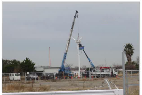
見慣れた風力発電機が撤去された