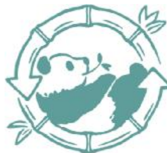
パンダバンブータンブラー