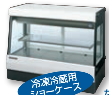
冷凍冷蔵用 ショーケース