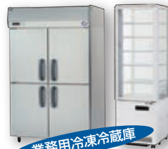
業務用冷凍冷蔵庫