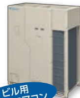
ビル用 マルチエアコン