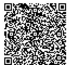
大阪府行政オンラインシステム （制度・提出書類なども記載）