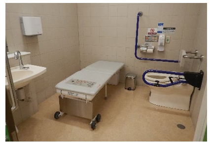
折り畳み式大型ベッドのある便房

<留意点> 洗面器 ・車椅子回転スペースに洗面器が張り出さないように、製品機種の選定に配慮する。