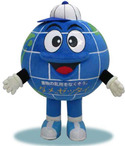
(1) 着ぐるみ「ダメ。ゼッタイ。君」