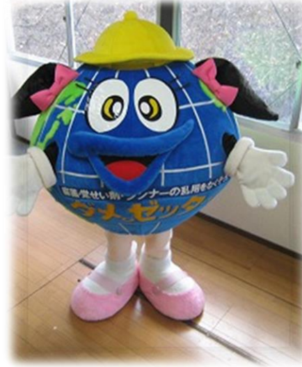
(2) 着ぐるみ「ダメ。ゼッタイ。子ちゃん」