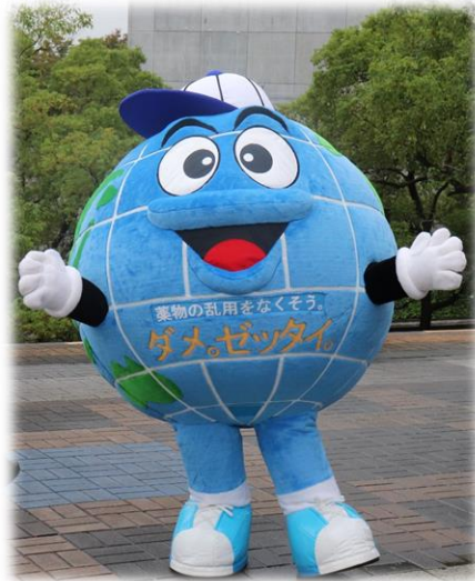
(1) 着ぐるみ「ダメ。ゼッタイ。君」