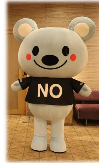
(2) 着ぐるみ「ダメ。くま」くん