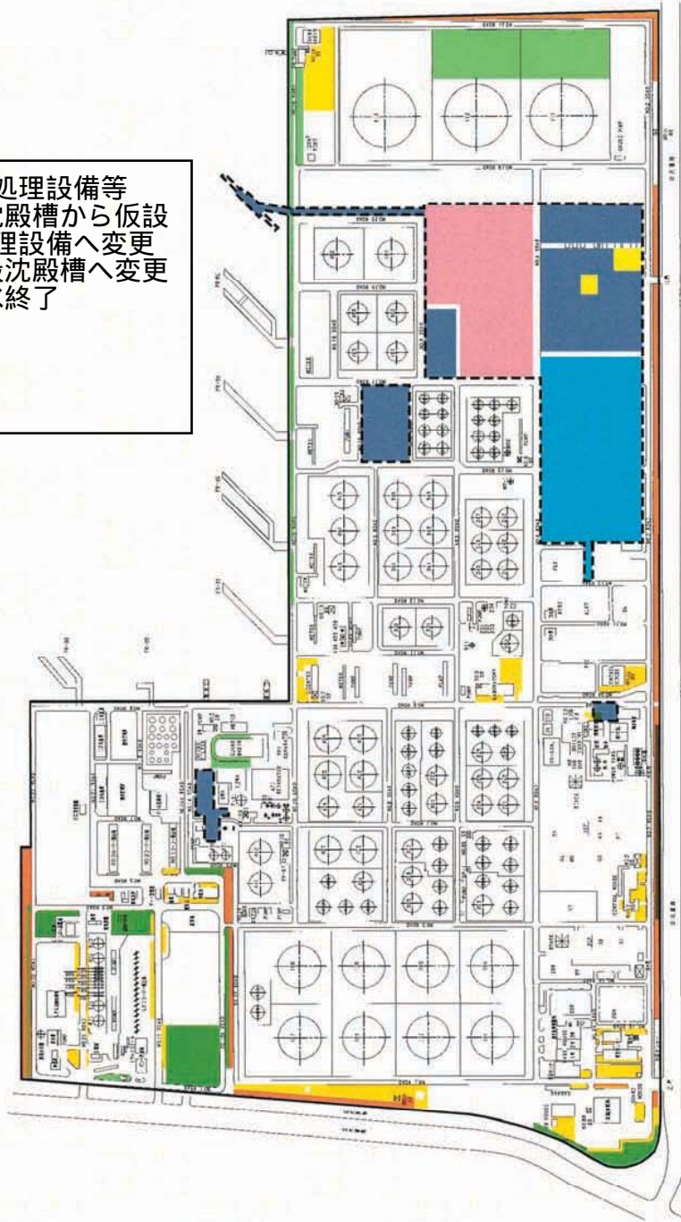
図-1. 仮設凝集沈殿処理設備等の設置場所（工事中）

仮設凝集沈殿処理設備等 9/6に仮設沈殿槽から仮設 凝集沈殿処理設備へ変更 10/16～仮設沈殿槽へ変更 10/18に排水終了 9/8～稼働 9/9～稼働 10/3～稼働 10/4～稼働