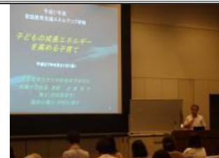
「子どもの成長エネルギーを