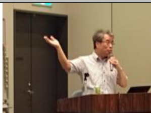
講師は、奈良教育大学