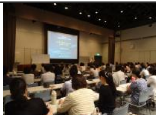
家庭教育支援関係者、