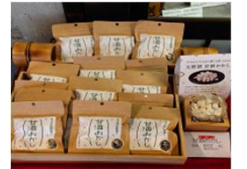
地域ならではの観光資源を活用した商品開発