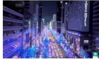
御堂筋イルミネーション