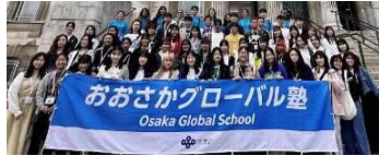
おおさかグローバル塾

府内の高校生等を対象に、模擬施設等を活用した外国人スタッフとの実践的英語体験活動を実施することで、参加する生徒が、海外への興味・関心を高め、英語でコミュニケーションをとることの楽しさを実感するとともに、外国人に自分の考えを伝えたり、大阪の魅力を紹介するなど、自然に英語で交流を図ることができるコミュニケーション感覚や能力を育成する。