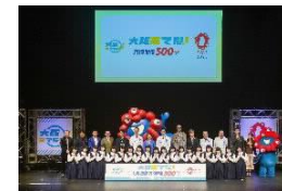
万博開催500日イベント