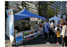
イベントでの魅力発信ブース