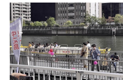
秋の水都大阪ウィーク