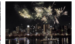
冬の水都大阪ウィーク