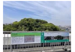
多言語解説パネル