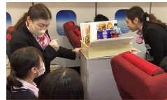
グローバル体験プログラム