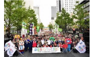
御堂筋ランウェイ2023の様子