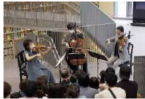
大阪クラシック