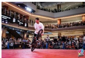
プレイイベントの様子