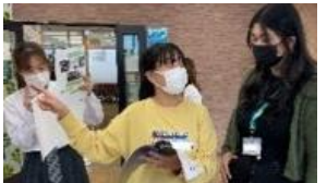
グローバル体験プログラム

② 定員2,000名でプログラムを実施中(2022年6月～2023年3月) ・ 1月末時点で約1,863名が参加し、英語の習得意欲及び海外に関する関心が高まった割合が95%以上