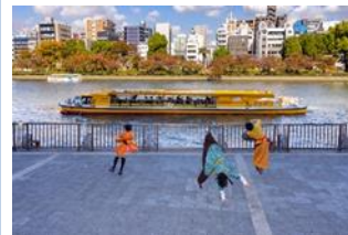
秋の水都大阪ウィーク