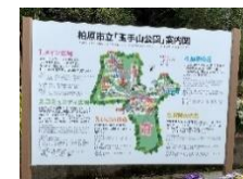
多言語観光案内板