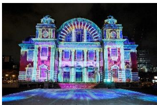
OSAKA光のルネサンス （大阪市中央公会堂壁面プロジェクションマッピング）