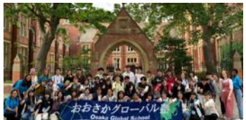
おおさかグローバル塾