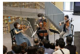
大阪クラシック