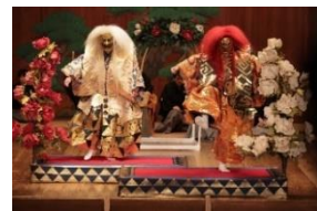
秋の謡会 (能楽と現代音楽がコラボした特別公演)