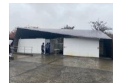
観光公衆トイレの洋式化