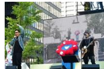
御堂筋ランウェイ2022の様子