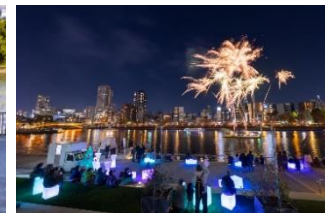
冬の水都大阪ウィーク