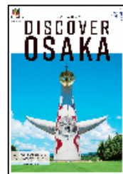
観光ガイドブック