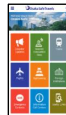
Osaka Safe Travels