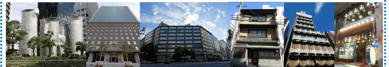
梅田吸気塔 ダイビル本館 大阪商工信用金庫新本店ビル 北野家住宅 食道園 純喫茶アメリカン 宗右衛門町本店ビル

梅田吸気塔／大阪ガスビル／ダイビル本館 /三井住友銀行大阪本店ビル ルポンドシエルビル（大林組旧本店）／日本聖公会川口基督教会／大阪証券取引所ビル 生駒ビルディング／武田道修町ビル／船場ビルディング／新井ビル／堺筋倶楽部 大阪商工信用金庫新本店ビル〔計画〕（旧本町ビルディング）／北野家住宅／清水猛商店 芝川ビル／大阪倶楽部／輸出繊維会館／日本基督教団大阪教会 今橋ビルディング（旧大阪市中央消防署今橋出張所）／グランサンクタス淀屋橋 大丸心斎橋店本館／南海ビル（高島屋大阪店ほか）／高島屋東別館／ 食道園宗右衛門町本店ビル 純喫茶アメリカン／船場センタービル /西長堀アパート